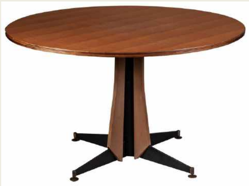
MESA CIRCULAR EN MADERA, SIGLO XX