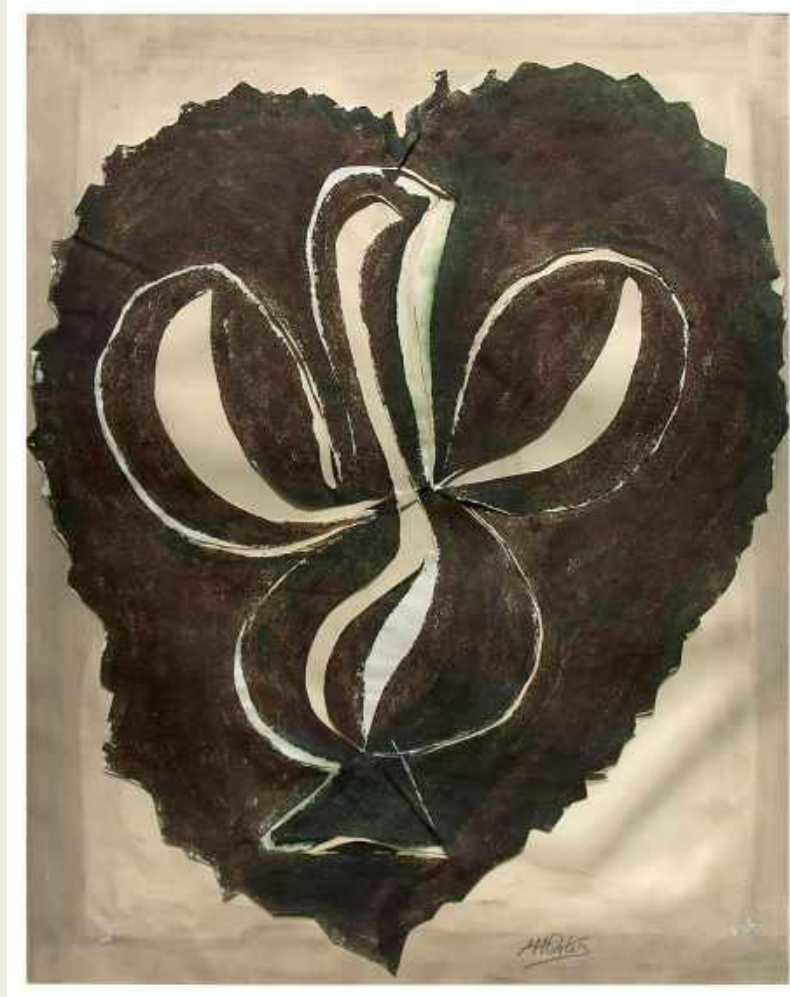
"PALOMA" BLANCO Y NEGRO. COLLAGE FIRMADO. 55,5 x 44 CM. 73 x 60,5 CM ENMARCADO