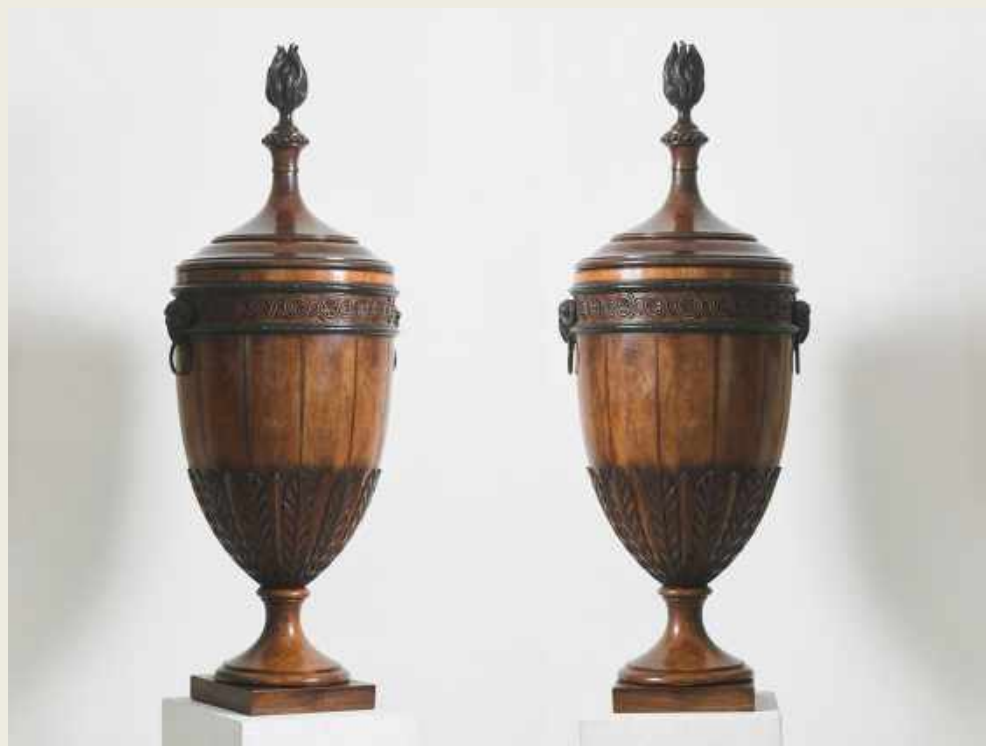
PAREJA DE COPAS/CUBERTEROS. INGLATERRA, CA. 1780. MADERA, 86 CM.