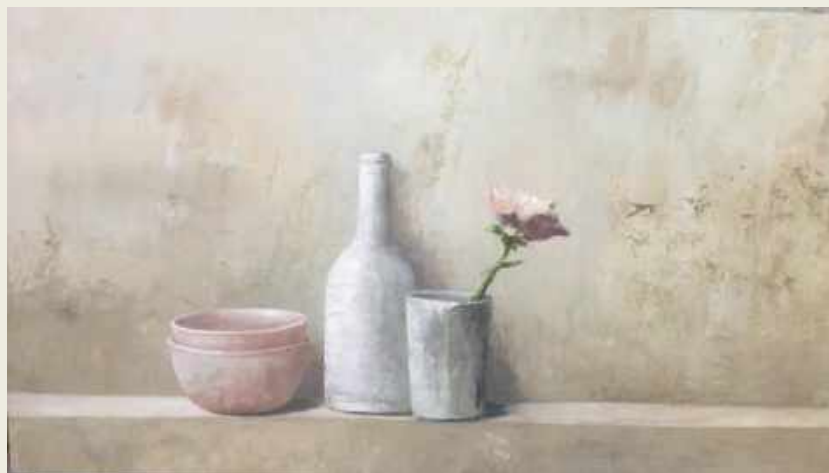
BODEGÓN CON FLOR. ÓLEO SOBRE TABLA, 40 X 90 CM