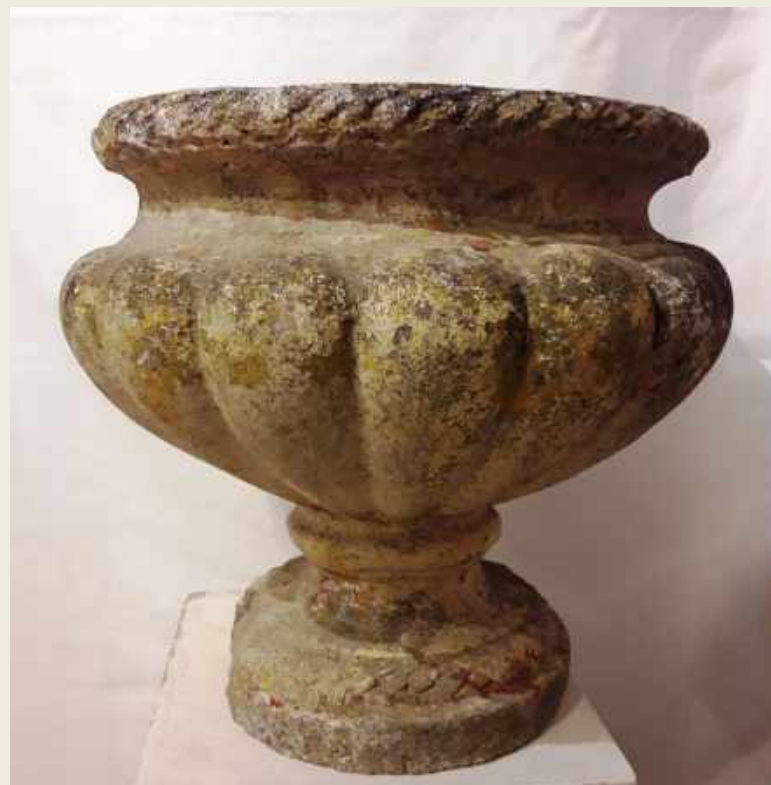
COPA DE JARDÍN. EN PIEDRA, SIGLO XIX. 49 X 50 CM