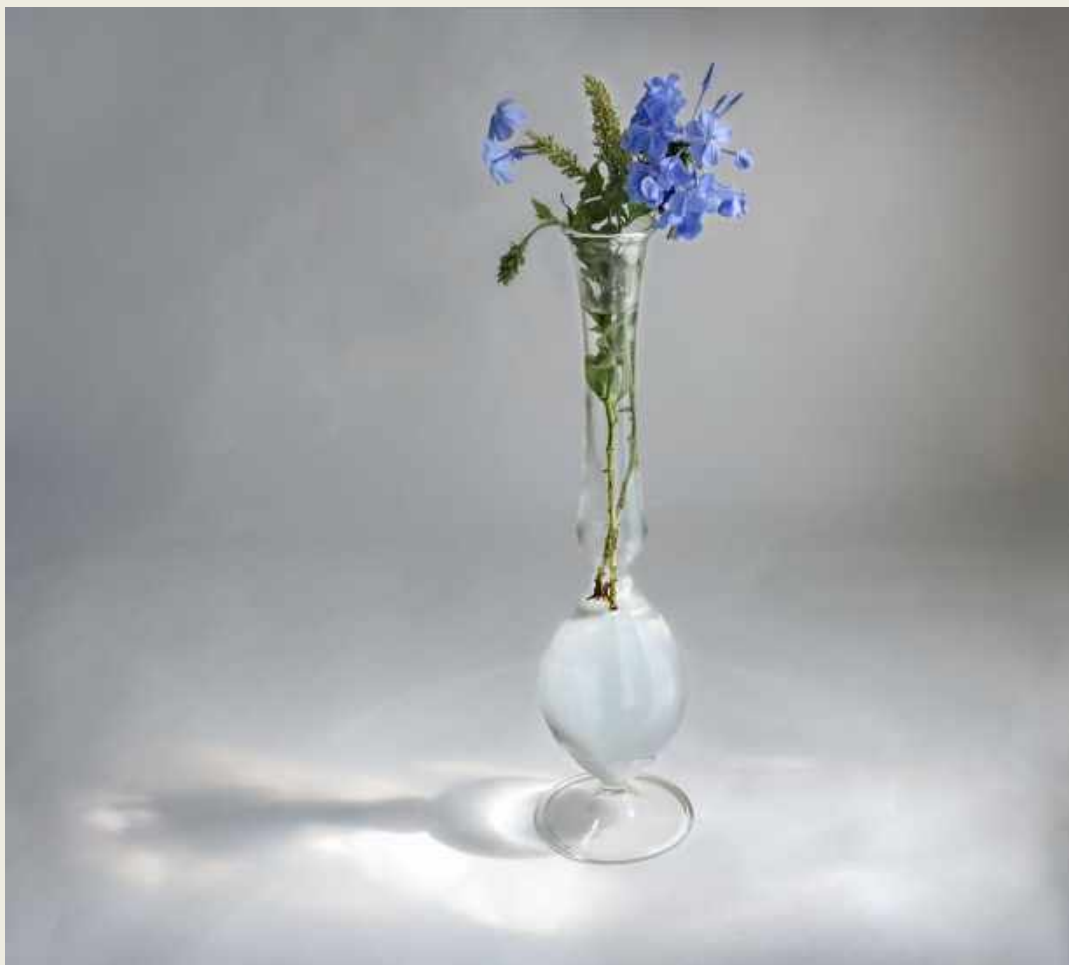
PLUMBAGO, 2013. SERIE TRANSPARENCIAS. FOTOGRAFÍA, EDICIÓN DE 15 EJEMPLARES.