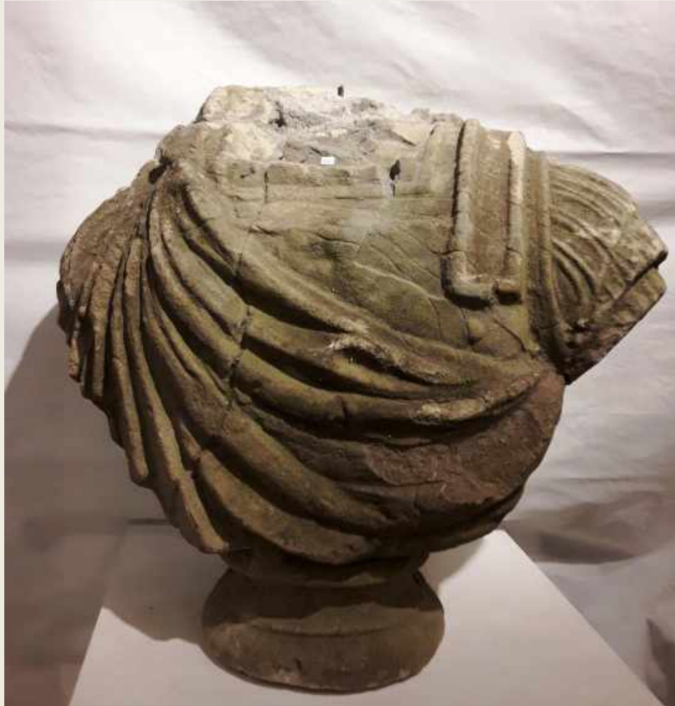
BUSTO FRANCÉS, SIGLO XIX. EN PIEDRA, 55 X 30 X 60 CM