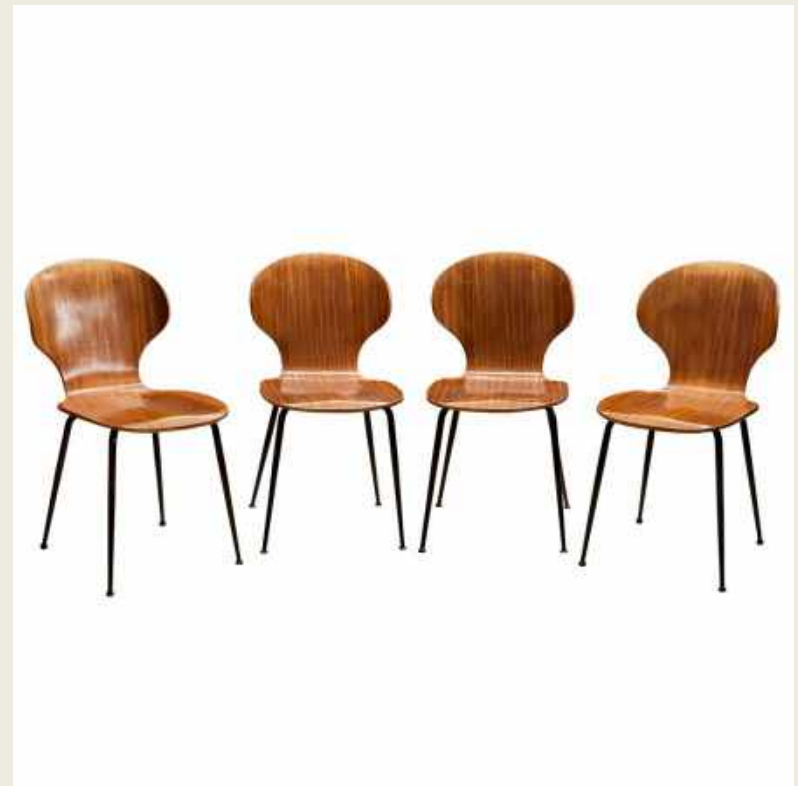
4 SILLAS CARLO RATTI ITALIA SIGLO XX AÑOS 50-60