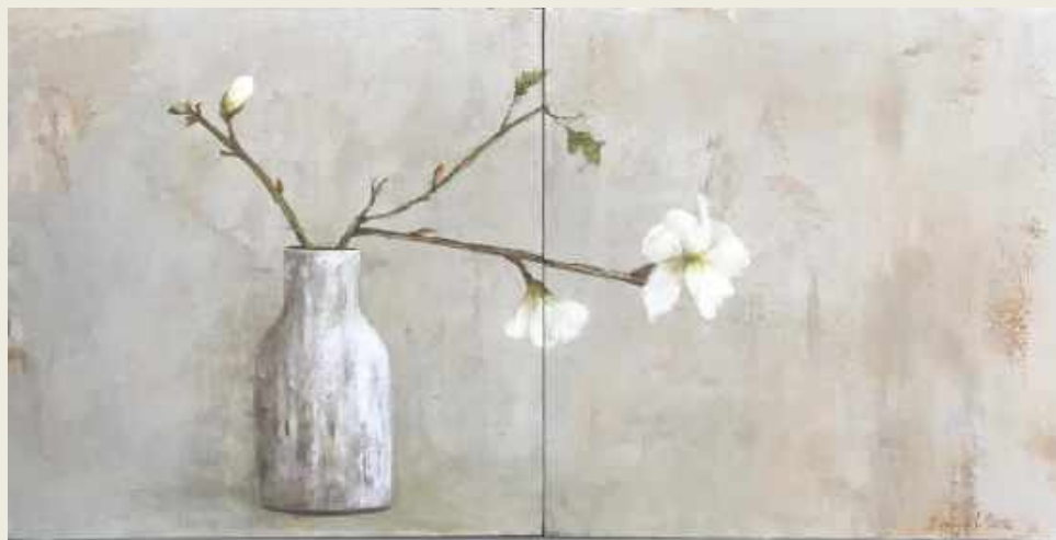
FLOR BLANCA. ÓLEO SOBRE TABLA, 30 X 60 CM