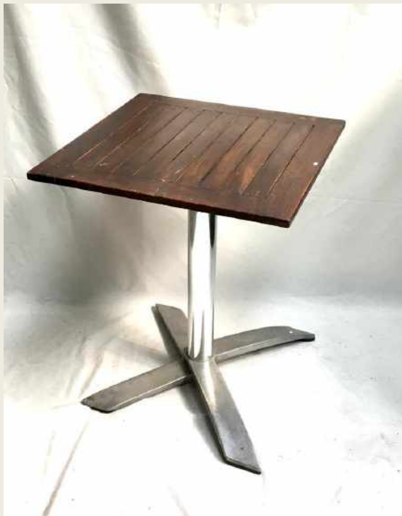
VELADOR CON TAPA DE MADERA Y PIE METÁLICO. SIGLO XX