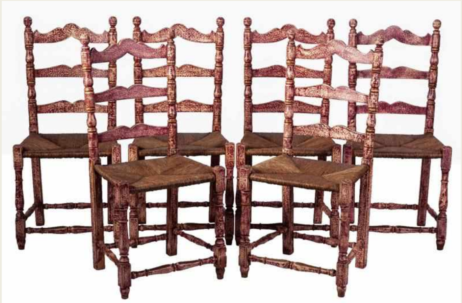
SILLERÍA ARAGONESA, EN POLICROMÍA ROJA, S. XVIII, 6 UNIDADES