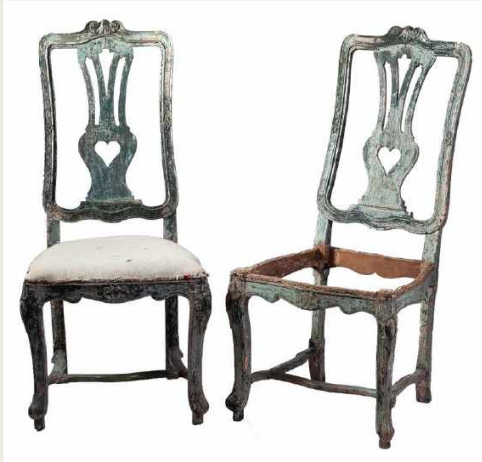
PAREJA DE SILLAS FELIPE V VERDES, ARAGÓN, S. XVIII