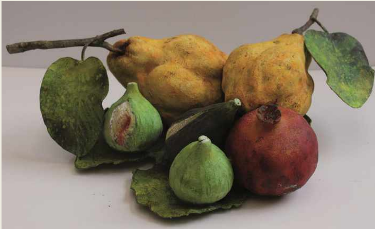
BODEGÓN CON MEMBRILLO, GRANADA, BREVAS E HIGOS. BRONCE FUNDIDO A LA CERA PERDIDA. PATINADO Y POLICROMADO AL ÓLEO. 40 X 13 X 33 CM