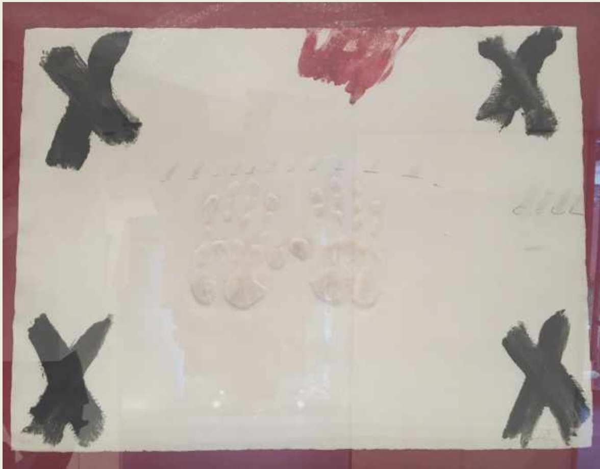
DUES MANS SERIE NEGRE I ROIG, 1976. EDICIONES POLÍGRAFA. GRABADO EN VARIAS TINTAS Y RELIEVE SOBRE PAPEL GUARRO, 76 x 95 CM ENMARCADO