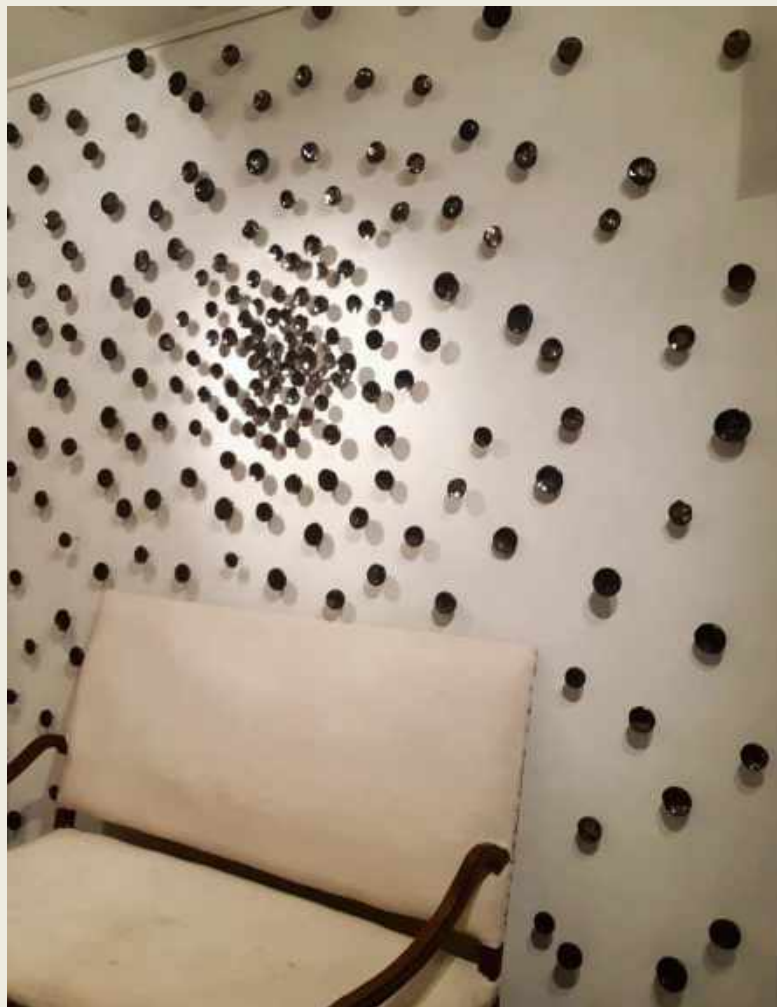
FALLING IN LOVE. 2020. CERÁMICA ANCLADA A LA PARED UNOS 200 PÉTALOS EN VARIAS TONALIDADES DE COLOR ANTRACITA