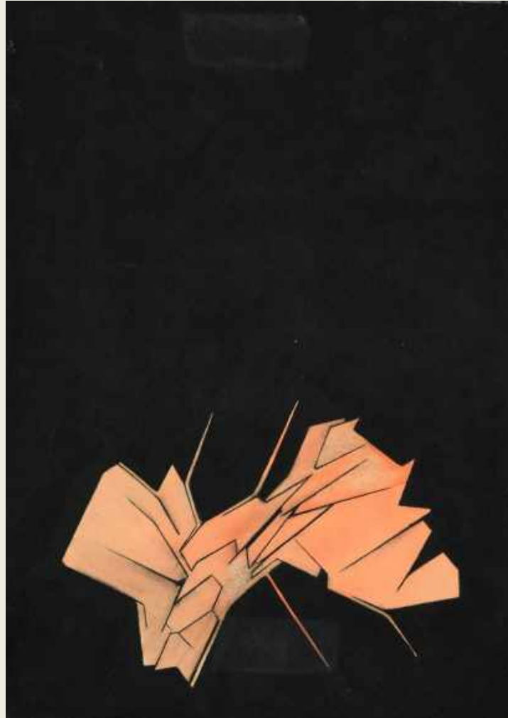
SIN TÍTULO, 1965. GOUACHE SOBRE PAPEL, 27 X 19 CM. 49 X 42 CM CON MARCO