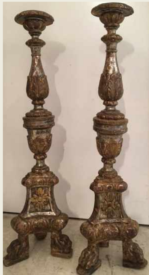
CANDELEROS EN MADERA TALLADA. POLICROMADA Y PLATEADA. ITALIA, SIGLO XVIII. 88 x 14 CM. 3 UNIDADES