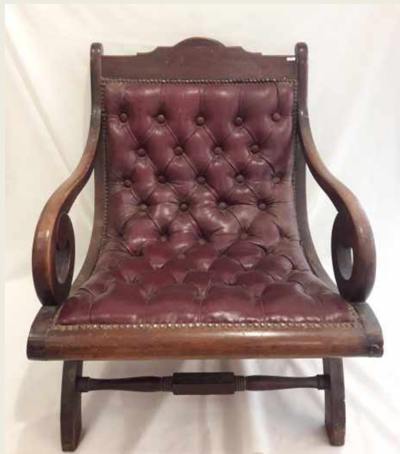
SILLONES EN MADERA Y CUERO. HACIA 1800