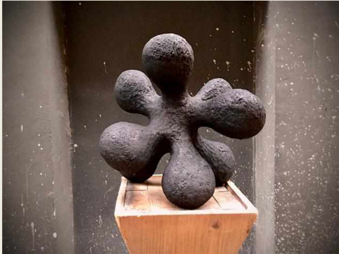
DHARMA. 2020. PIEZA ÚNICA. ARCILLA RECUBIERTA DE EPOXI Y PIGMENTOS 50 X 50 X 50 CM