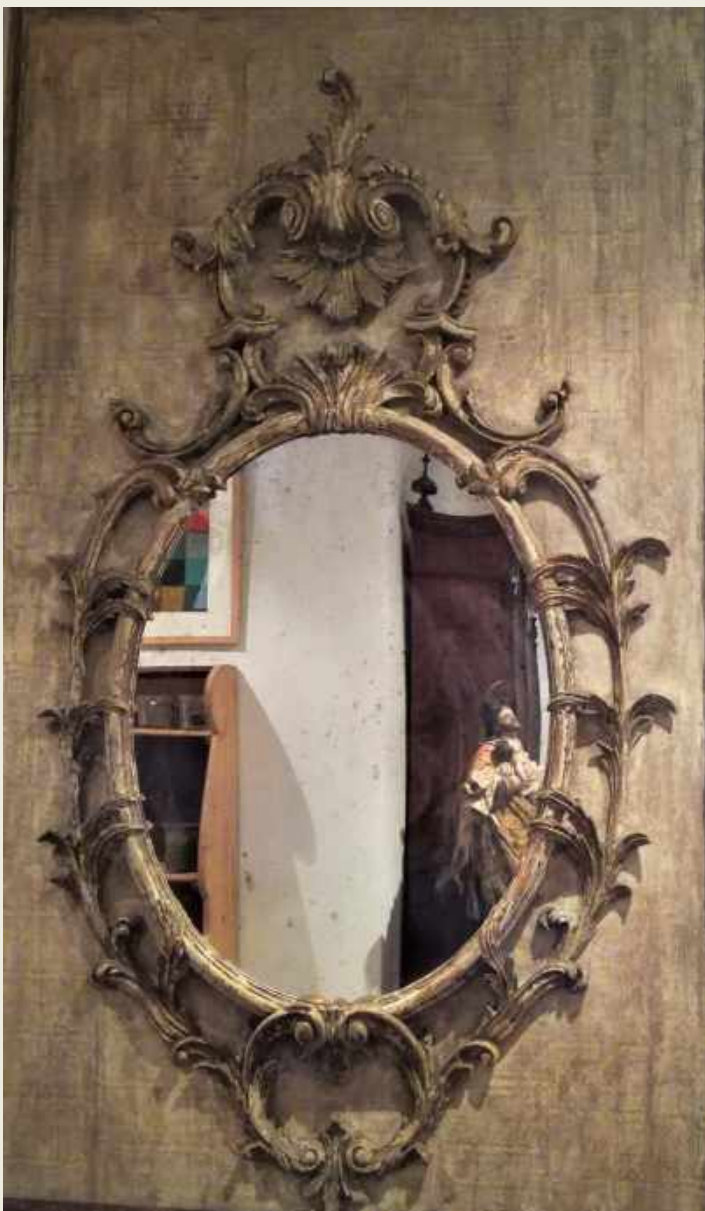
ESPEJO EN MADERA TALLADA. ITALIA, SIGLO XIX. 190x 104 CM