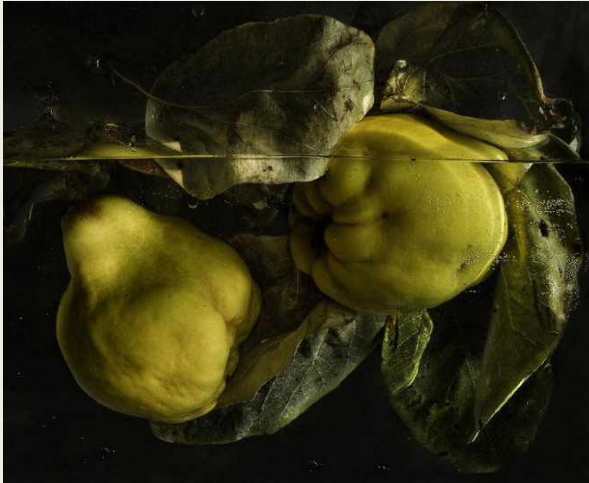
PLANTAS SUMERGIDAS. MEMBRILLOS, 2010. FOTOGRAFÍA. EDICIÓN DE 15 EJEMPLARES