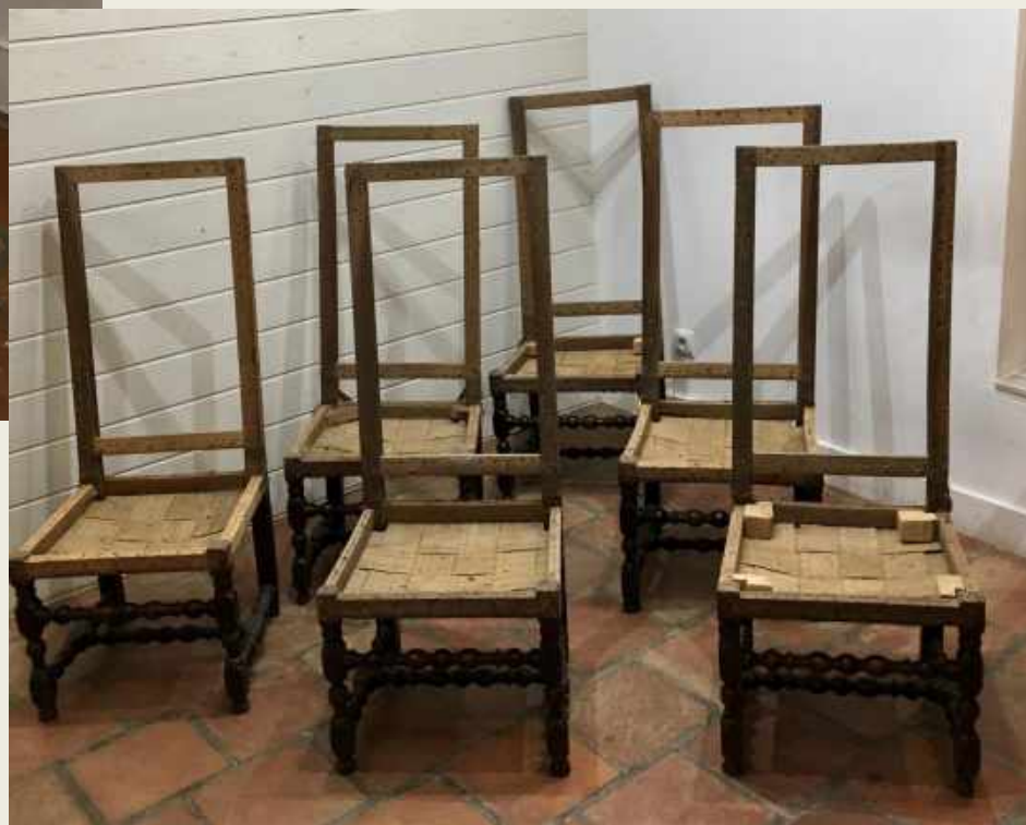
SILLERÍA FRANCESA LUIS XIII, 6 UNIDADES