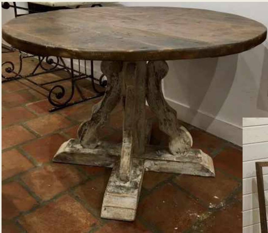
PAREJA DE MESAS ITALIANAS, SIGLO XIX. MADERA CON RESTOS DE POLICROMÍA. 120 CM DIÁMETRO