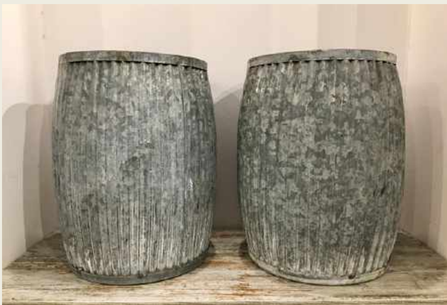
CONTENEDORES EN METAL USADOS ANTIGUAMENTE PARA RECOGER AGUA DE LLUVIA. 46 X 32 CM. 3 UNIDADES