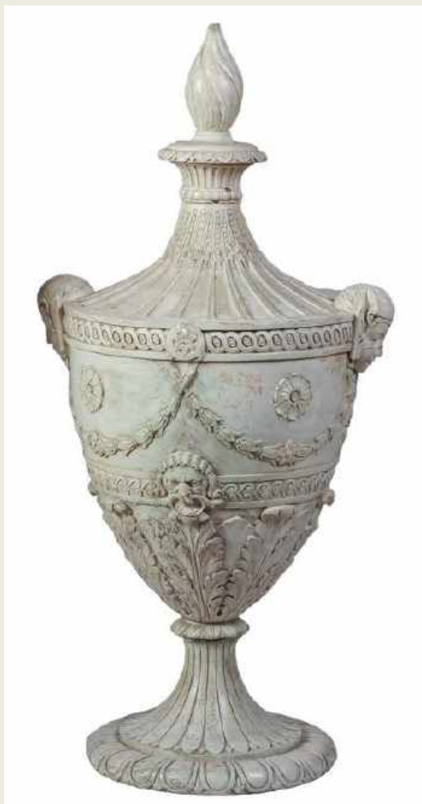
COPA NEOCLÁSICA TRABAJO ITALIANO, SIGLO XIX. ESTUCO POLICROMADO EN BLANCO, 90 CM