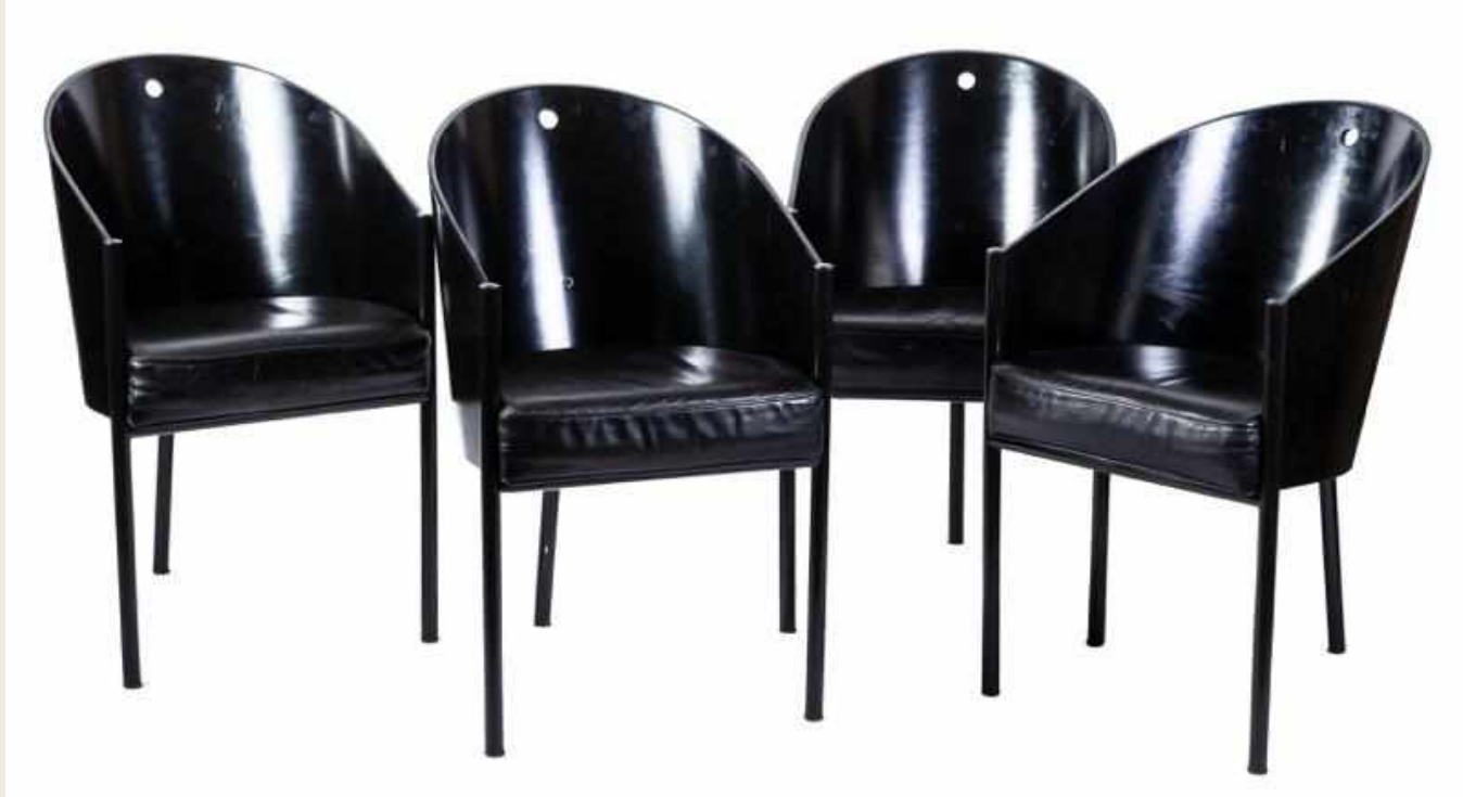
4 SILLAS PHILIPPE STARCK AÑOS 80-90