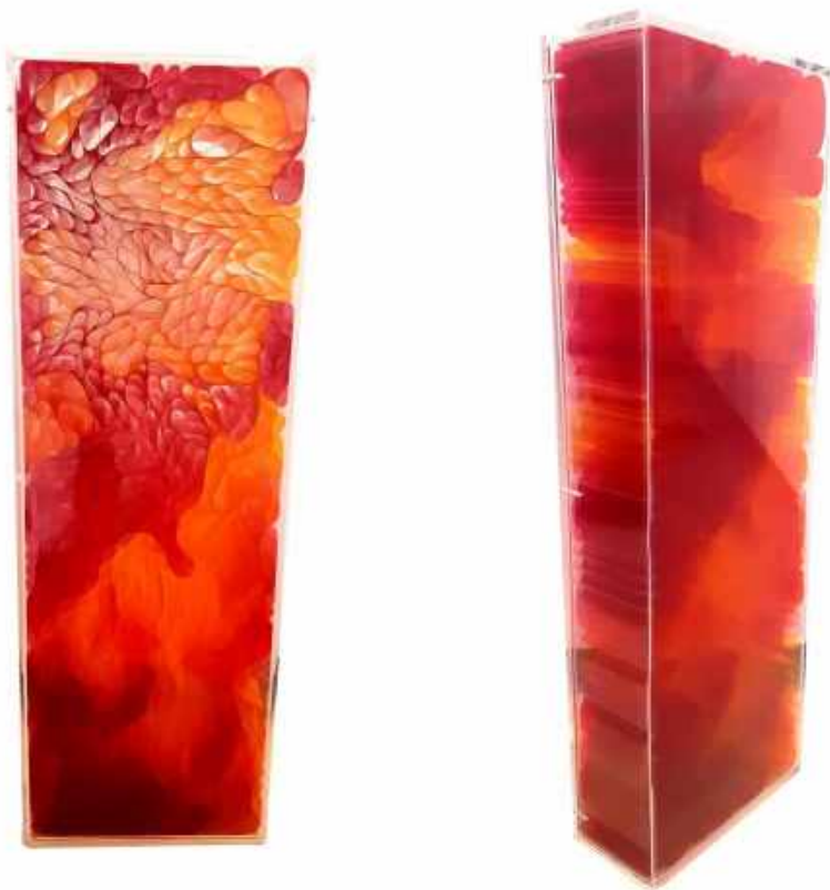
CAJA DE LUZ ROSA, 2020 METACRILATO POLIÉSTER, PVC, PELÍCULA 35MM, FILTROS DE ILUMINACIÓN 60 X 8 X 20 CM