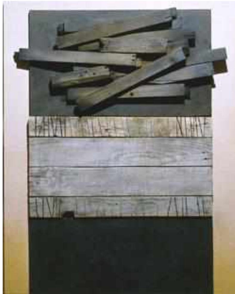
RELIEVE, 2008. 100 X 80 CM