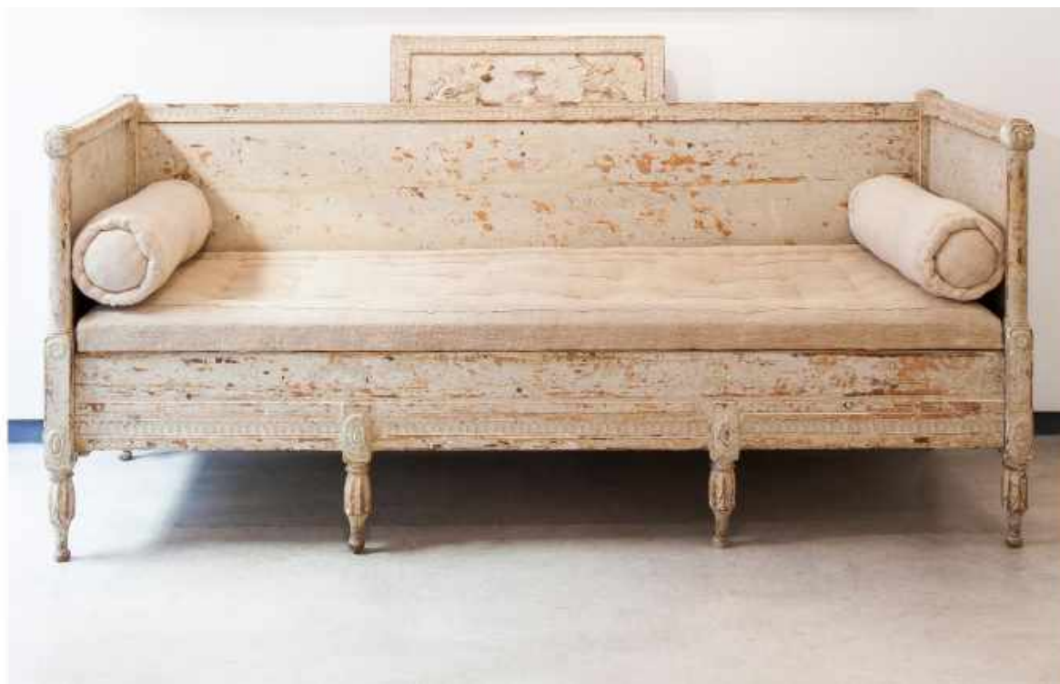
BANCO EN MADERA TALLADA Y POLICROMADA. SUECIA, SIGLO XIX 99 x 63 x 187 CM