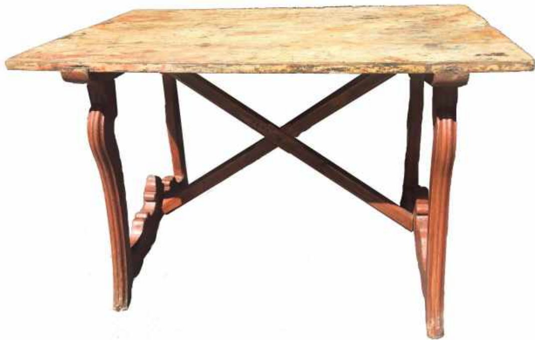
MESA EN MADERA POLICROMADA. ARAGÓN, SIGLO XVIII 76 x 81 x 117,5 CM