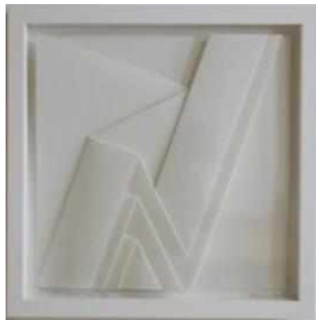
QUADRAT UND RECHTECKE, 2016

PAPEL CANSON DE ACUARELA PLEGADO, 30 X 30 CM