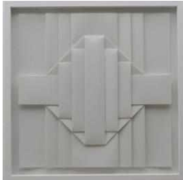
DURCHDRINGUNG PAPEL CANSON DE ACUARELA PLEGADO, 50x50CM