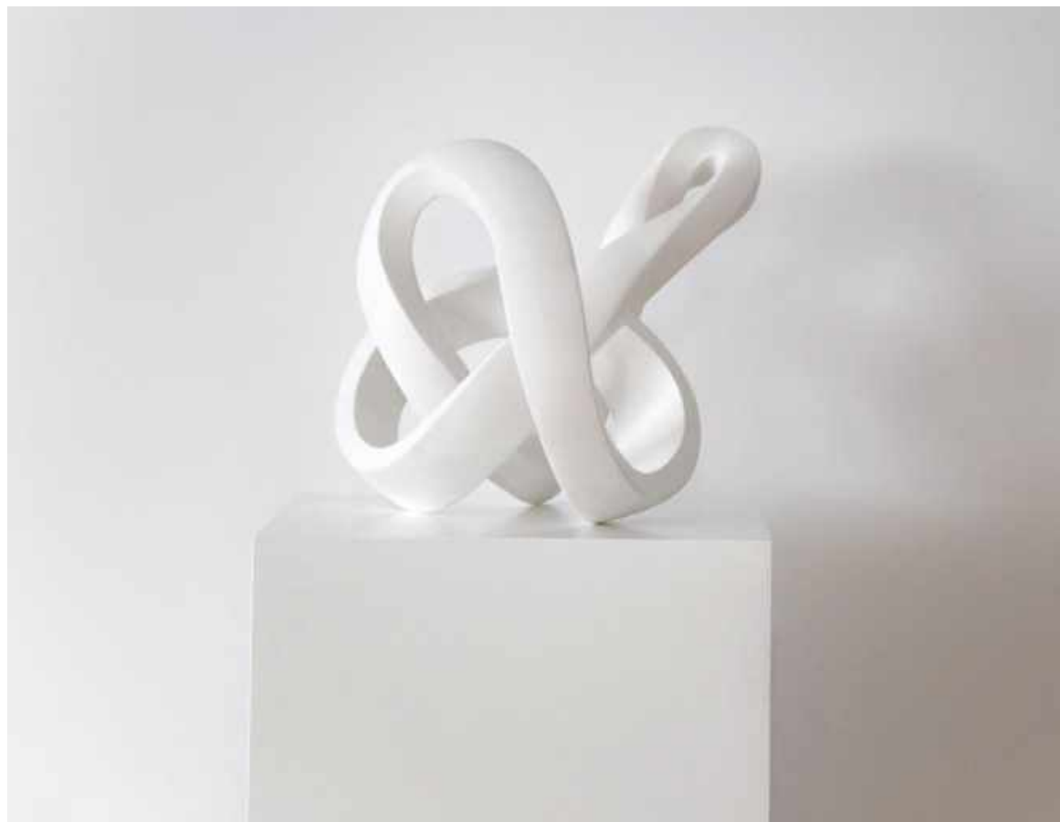
SUSPIRO MARINO. RESINA ACRÍLICA. 40 X 37 X 38 CM