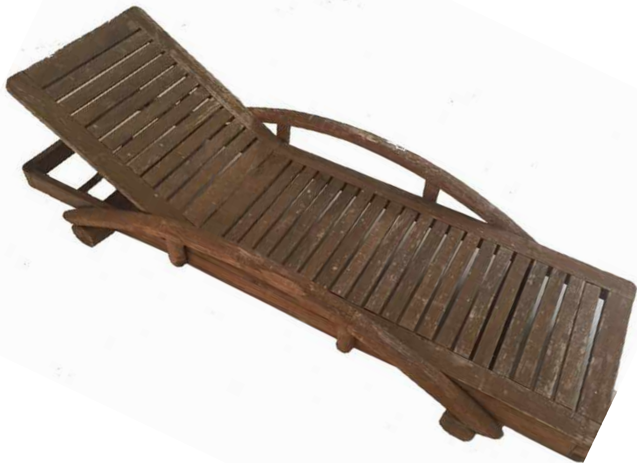
CUATRO TUMBONAS EN TEKA CON MESITA AUXILIAR A JUEGO. TUMBONA: 59 X 72 X 200 CM