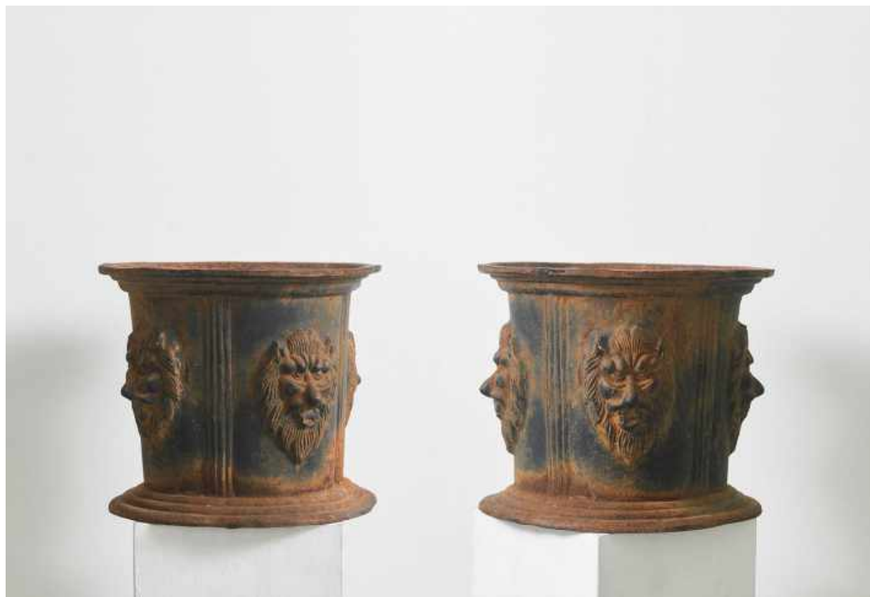
PAREJA DE CACHE POTS. ITALIA. SIGLO XIX