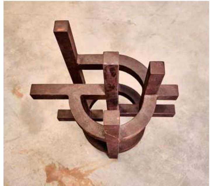
CÍRCULO DEL VACÍO 2009 ORIGINAL DE 7. ACERO, 56,5 x 43 x 29 CMS