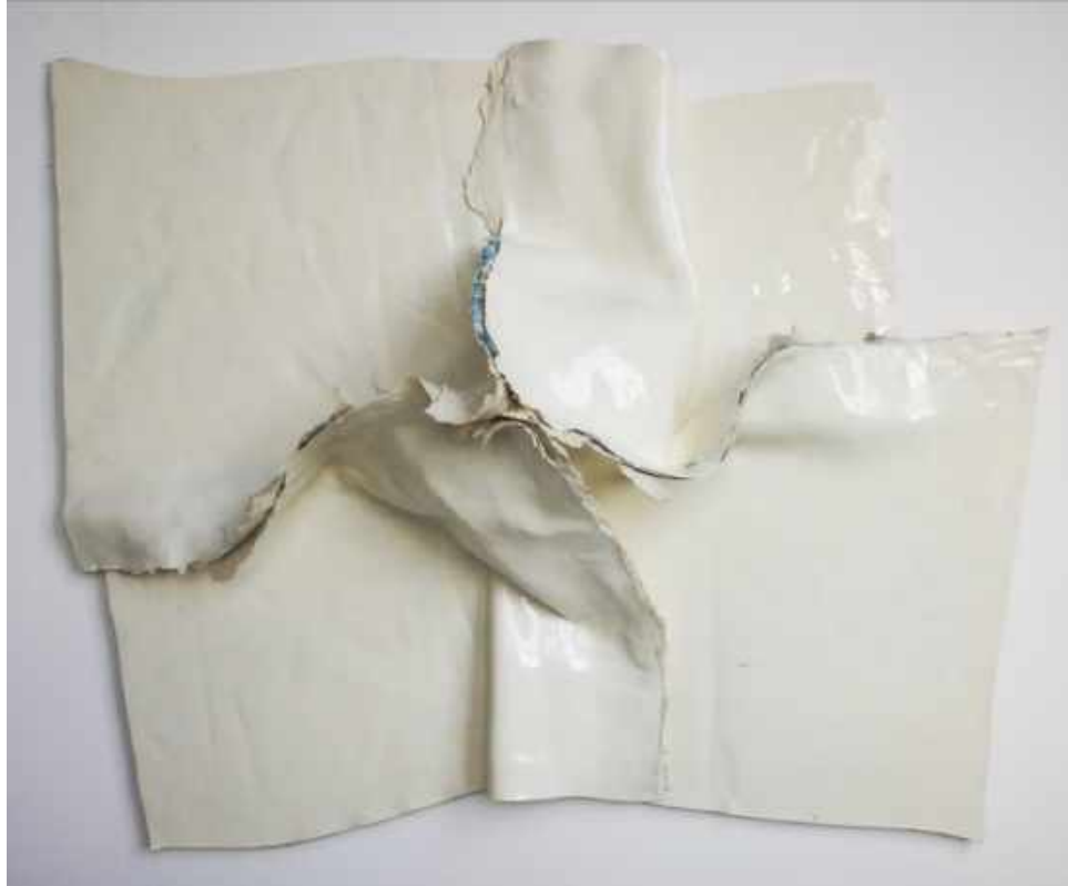
CAP DE CREUS. BLANCO. ACRÍLICO/LIENZO 125 X 40 X 150 CM