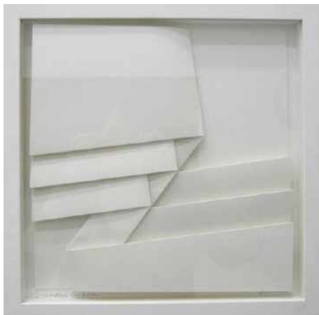
3 VERSCHOBENE RECHTECKE, 2016

PAPEL CANSON DE ACUARELA PLEGADO, 30 X 30 CM