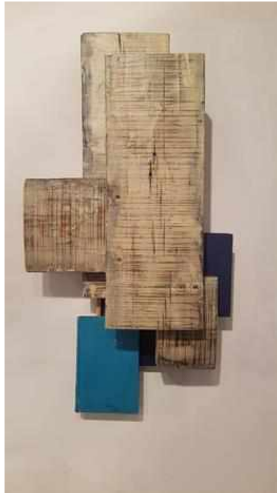
LÍNEAS HORIZONTALES Y VERTICALES CON AZUL, 2016.