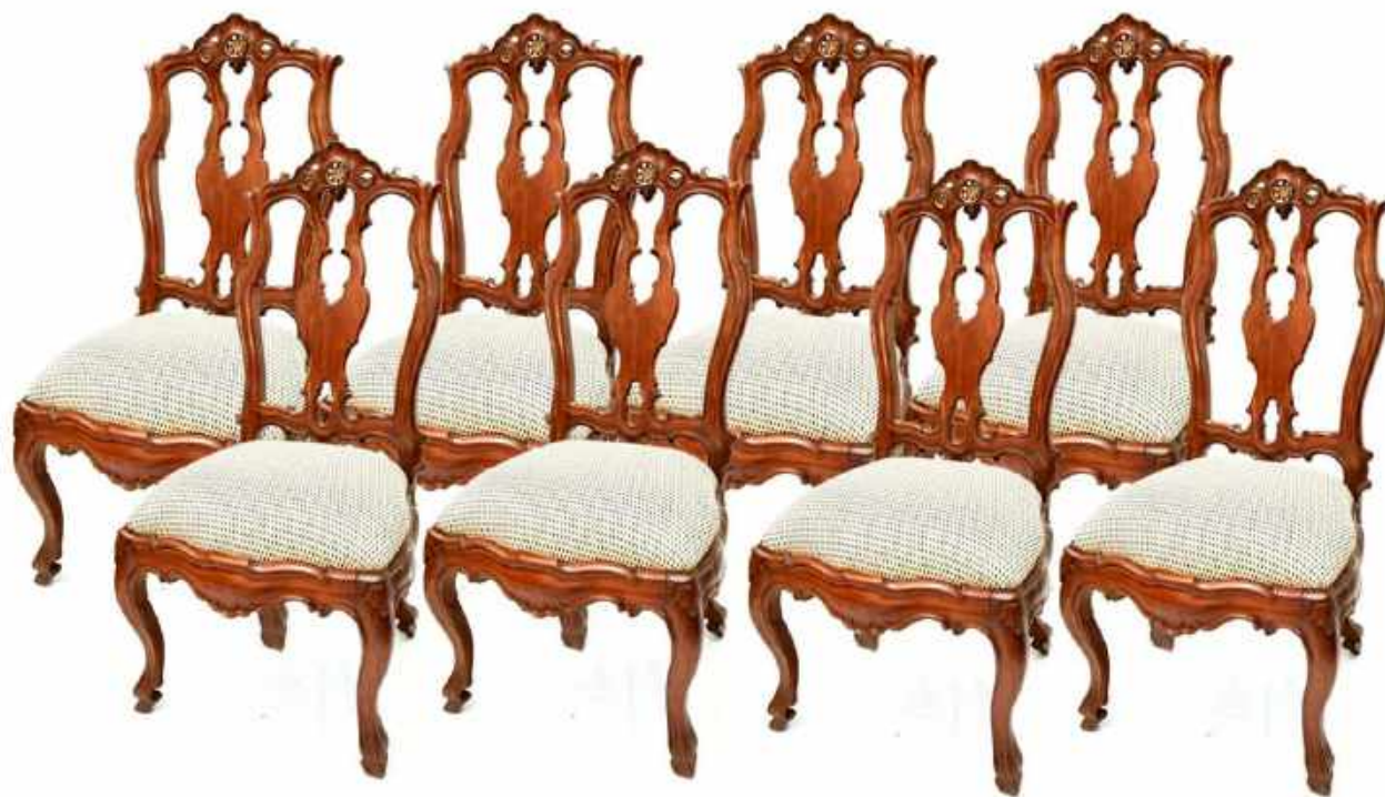
CONJUNTO DE OCHO SILLAS. CATALUÑA, SIGLO XVIII 100 x 43 x 50 CM