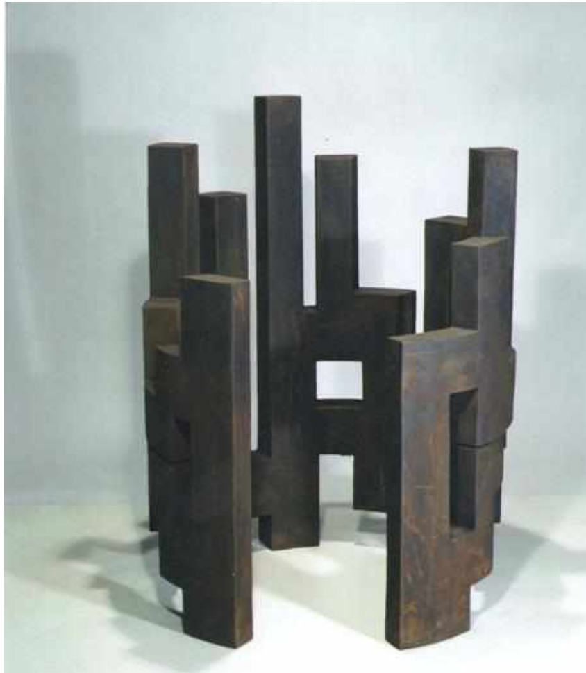
CILINDRO DEL VACÍO 4 ACERO CORTEN 133 x 102 x 100 CM