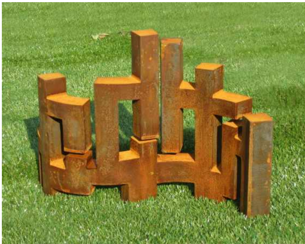
ONDULADA DEL VACÍO 5/25 HIERRO 45 x 30 x 13 CM