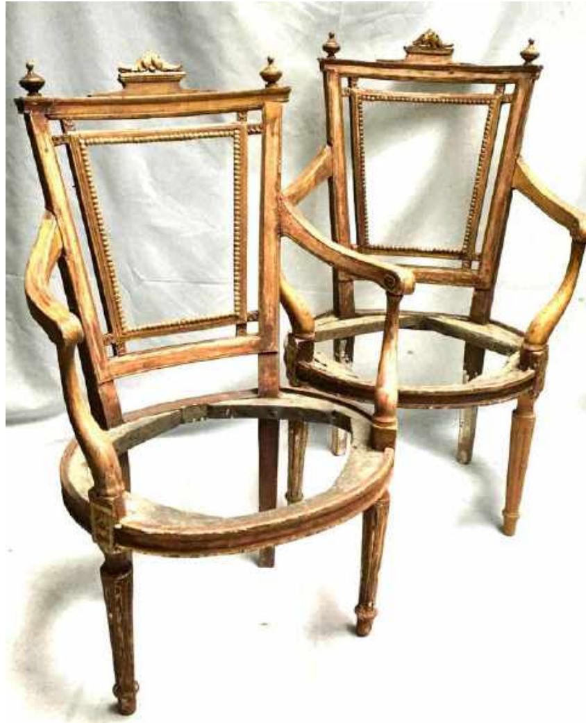
PAREJA DE BUTACAS EN MADERA CON RESTOS DE POLICROMÍA. ÉPOCA CARLOS IV. 100 x 64 x 66 CM