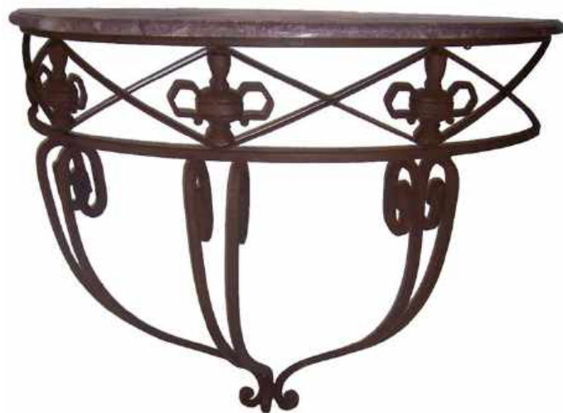
PAREJA DE CONSOLAS FRANCESAS. SIGLO XIX. HIERRO Y MÁRMOL 92 x 45 x 114 CM