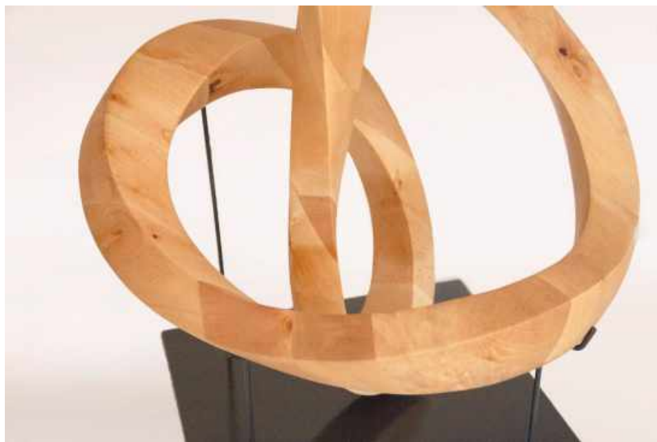
ASPA. 47 x 54 x 37 CM